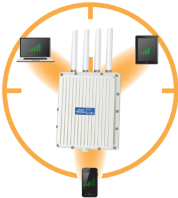
Dedicated and stable signals