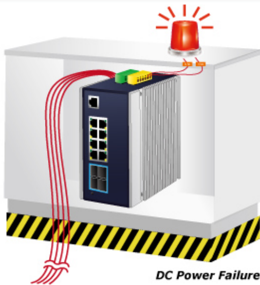
DC Power Failure